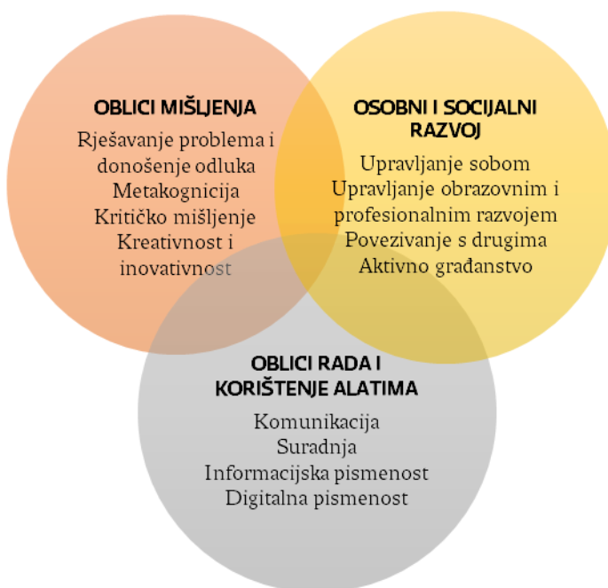
2. slika: Grafički prikaz generičkih kompetencija